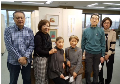
【版画サークルのメンバー】

木版画で年賀状を製作す るようになって50年近く になりますが、20年ほど 前から、公募展に出展する ようになりました。公募展 に出展する作品は、60× 45cm程度と作品の製作規 模が大きくなります。最初 に挑戦したのは全道展で初 出展、初入选した時の喜び が嬉しく、以降毎年出展し 続け、一時は国立美術館で 開催される太平洋美術展(2 011年会員)と春陽展(2 016年会員)にも出展して いました。現在は全道展の みに出展しています。