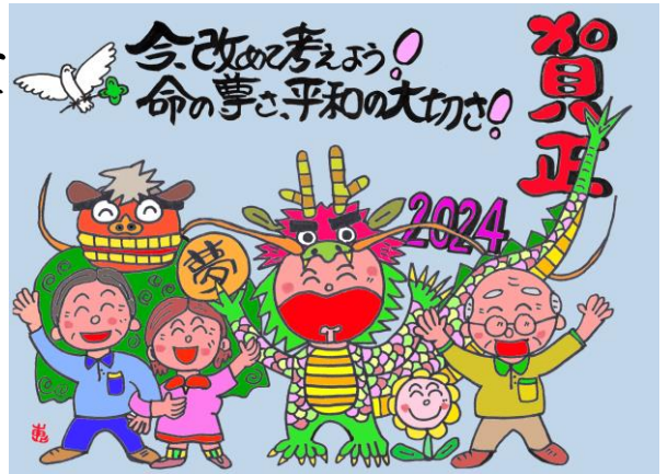
イラスト：榎原恵一さん(千歳市)

「新しい戦前」二度と繰り返さな 現在、私たち会員の連絡先は、現役時代と同様に電通共済協会のシステムに登録されており、連絡先や住所等は「一か所のみ」の登録が大半です。 「会」と会員を繋ぐ唯一の連絡先が前述の様な高齢化に伴う事情によって機能しないケースもあり、更に災害時における「安否確認」や「被災状況の把握」を可能とする為、「第一の連絡先」の