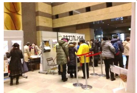
【大勢の来場者で賑わったカレンダー市】