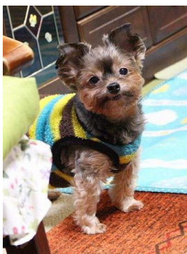
『サクラ』です。美人でしょ!

しがり屋さんです。その為、散歩には行きません。食事は、ドックフードはあまり好みませんが気が向いた時は食べます。鶏のササミ・カボチャの煮物・チーズ・食パンが好みで良