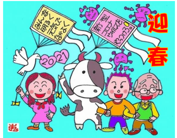
イラスト：榎原 恵一(千歳市)

新たな年を迎えました。引き続き、宜しくお願い致します。 「いつもと違う冬」とは、「北海道新聞」の新型コロナ特集号の見出しです。確かに現在、「自粛や中止」が相次ぐと共に、マスク姿や「三密」防止は定着した様に見える一方、感染は依然として急拡大しています。 多くの専門家が、「コロナの影響は2年〜3年は続く」と